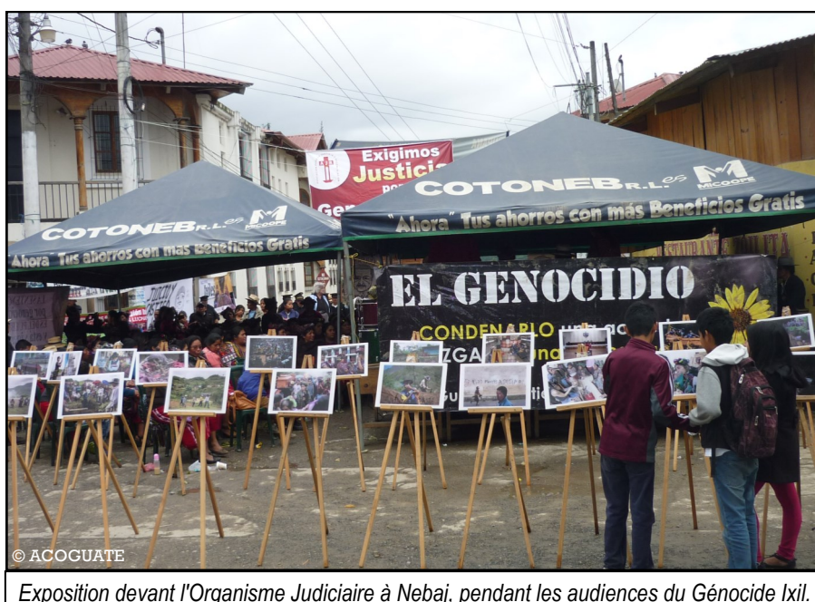
Exposition devant l'Organisme Judiciaire à Nebaj, pendant les audiences du Génocide Ixil.

la responsabilité de l'un des principal accusé, l'ancien général Ríos Montt, à la suite de son décès en avril 2018, terminant ainsi toute poursuite pénale à son encontre dans plusieurs cas de justice transitionnelle (Génocide contre le peuple Ixil et Dos Erres entres autres).