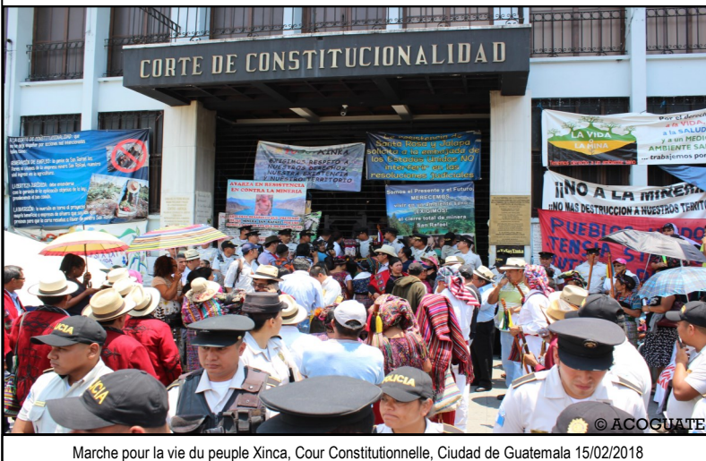
Marche pour la vie du peuple Xinka, Cour Constitutionnelle, Ciudad de Guatemala 15/02/2018

Ce que le discours officiel de l'entreprise n'a pas mentionné pendant toutes ces années, c'est la raison de la suspension de son activité, c'est-à-dire le non-respect des droits des populations autochtones. Notons tout d'abord des impacts environnementaux minorés (pollution de l'eau et des sols à l'arsenic et au plomb) qui impactent directement la santé des personnes qui consomment cette eau, la qualité des sols et la biodiversité. Notons aussi le déni des droits du peuple Xinka, dont le rejet massif du projet minier lors des consultations communautaires n'a pas été pris en compte, ainsi que la violence de l'État pour faire taire ces contestations : menaces, diffamations, attaques, assassinats, arrestations arbitraires... L'Etat de siège avait même été déclaré pendant 8 jours en mai 2013.