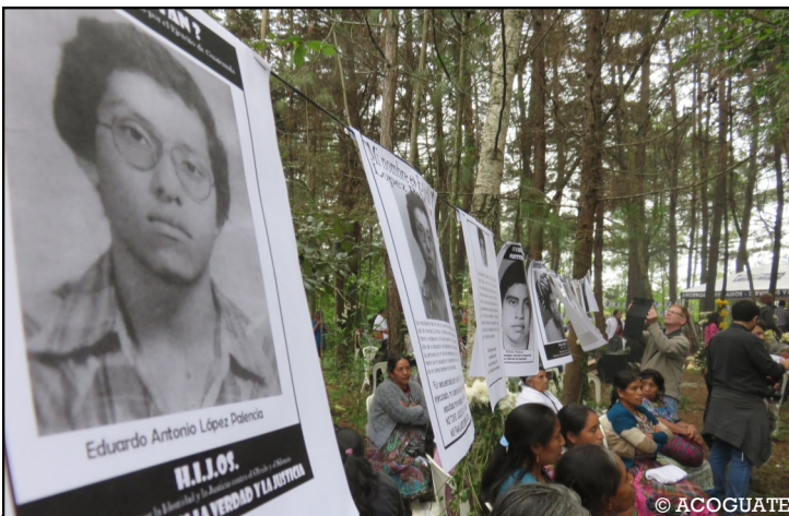
Portraits de victimes de disparitions forcées lors d'un événement commémoratif