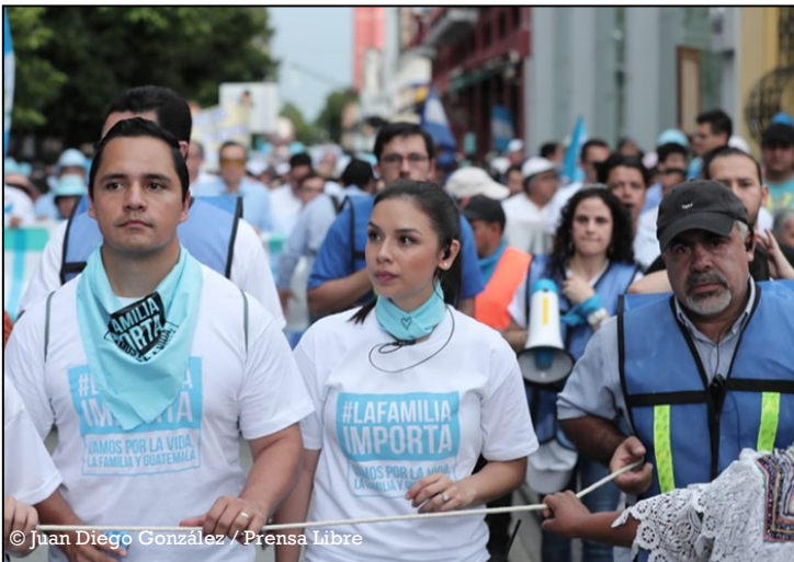
Marche « pro-vie », 2 septembre 2018

Cette mobilisation s'oppose au projet de loi 5376, qui cherche à dépénaliser l'avortement pour les jeunes filles de moins de 14 ans qui ont été victimes de viol, afin qu'elles puissent mettre fin à leur grossesse dans les 12 semaines suivantes.